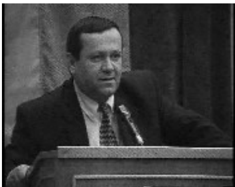
Д-р Хасан Адемов, председател на парламентарната Комисия по труда и социалната политика

Уважаема г-жо вицепремиер и министър на труда и социалната политика, Уважаеми г-н Христосков, госпожи и господа народни представители, Уважаеми господа бивши министри на труда и социалната политика, Уважаеми господа бивши управители на НОИ, Госпожи и господа,