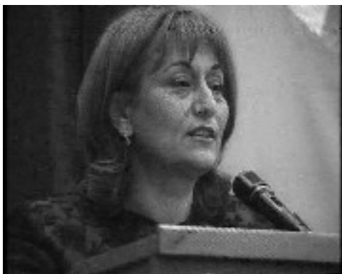
Лидия Шулева, вицепремиер и министър на труда и социалната политика, председател на НС на НОИ