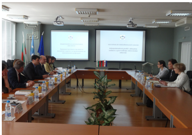
Обмяната на опит бе сред основните теми на разговорите между ръководителите на НОИ и ХИПО

време на разговорите теми беше и опитът на НОИ при прехвърлянето на пенсионни права от и към пенсионните схеми на Европейския съюз. Подробно беше разгледана и законодателната рамка, уреждаща вътрешен механизъм при обработката на заявления за трансфериране на натрупани пенсионни права от и към пенсионните схеми на институциите на Европейската общност.